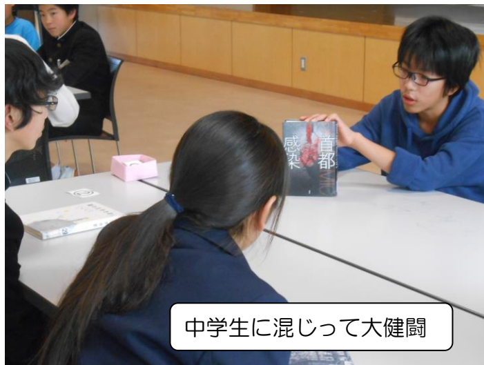
中学生に混じって大健闘

結果、19グループの中から何と、5名の6年生がチャンプ本を勝ち取りました。中学生に混じってこの結果は立派です。きっと大きな自信となったことでしょう（中学生の優しさや思いやりもあるか、とも感じつつ…）。中学生とともに活動できたことは、中学校の新生活に向けての不安が、わずかでも取り除かれたに違いないと感じました。