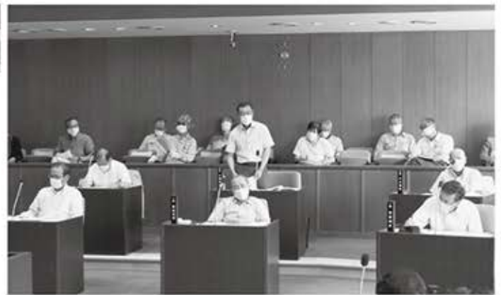
▲議場では全員がマスク着用