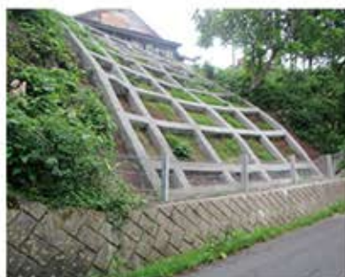
▲復旧した道路法面

昨年の台風19号で被災した各施設は、現在も復旧に向けて工事を進めております。被災した道路3件、橋梁1件のうち、道路1件は5月に完成、残りの道路2件は8月末、橋梁1件は年度内の完成を目指しております。