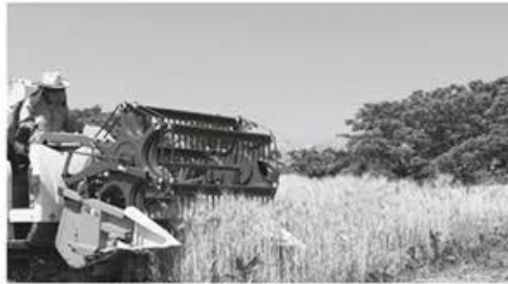
▲収穫中のホワイトファイバー

平成30年に麻績村地域交流センターで行われた、信州大学との連携事業「健康生活の達人教室in麻績」〜腸内環境と生活習慣病〜講演の中で「食物繊維の中でも『もち麦(特に長野県が開発したオリジナル品種)』は、うるち性の従来の品種と比