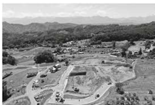
▲整備が進む小東(桑山)定住促進住宅