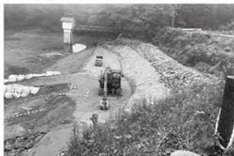
▲耐震改修工事中の大沼池

大沼池(すずらん湖)は令和元年5月から耐震改修工事を行ってありますが、8月末に工事が完成する見通しとなりました。