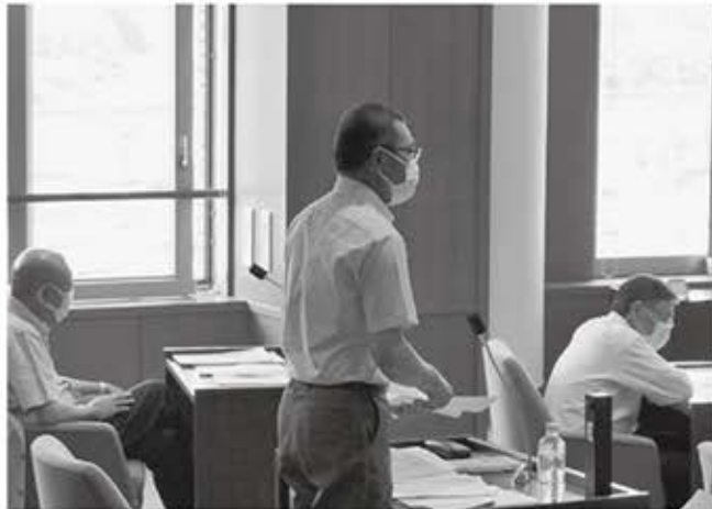
▲一般質問も自席で時間短縮