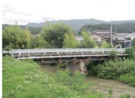
▲架替予定の矢倉橋

今後も、利便性・安全性を考慮した村道の改築に努めて参りますので、村民の皆さまのご理解とご協力をお願いいたします。