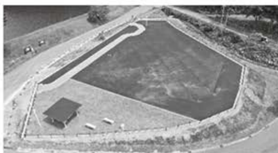
▲完成した聖湖畔の広場

廃ホテルの解体を含む善光寺街道整備事業が完了しました。聖湖周辺を散策される皆さまや、善光寺街道を歩かれる皆さまの憩いの場としてご利用ください。また、ドクターヘリ及び防災ヘリのヘリポートとしても活用されます。