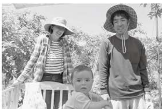
▲農業後継者として独立した協力隊

その結果、人口減少は続くものの若者移住者が増え子どもの出生に繋がり大きな成果を上げることができました。