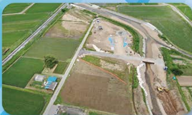
▲復旧が進む麻績川