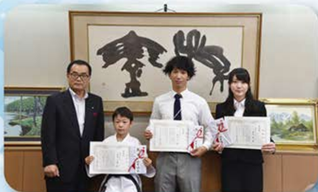
▲スポーツ功労者表彰