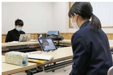
▲交流センターでオンライン授業

新型コロナウイルス感染症対策による臨時休校中の学習保障のために「ZOOM（ミーティングソフト）」を利用してオンラインでの学習を行いました。中学校は、5月に計4日間、午前8時50分から11時まで、ZOOMを利用しオンライン授業を行いました。