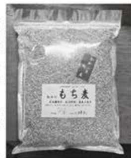
▲精麦されパッケージされたもち麦

麻績村内でも栽培され、麻績の市「あさつゆ」、「インターネット」でお買い求めになります。