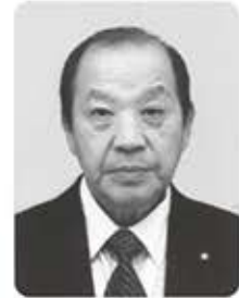
茂木 泰男 議員

問 学校組合の財産処 分について筑北村長と の協議は平行線の様 であったが、合意に至 る当村としての着地点 はどの様に考えるのか 答 地方自治法286 条2項による「構成団 体との協議を経ない特 例、議会の議決を経て 通告だけで解散できる 特例」による解散であ ると云う事であり、学 校組合からの脱退によ る解散。