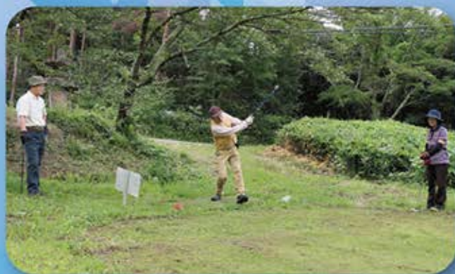
▲村長杯マレットゴルフ大会