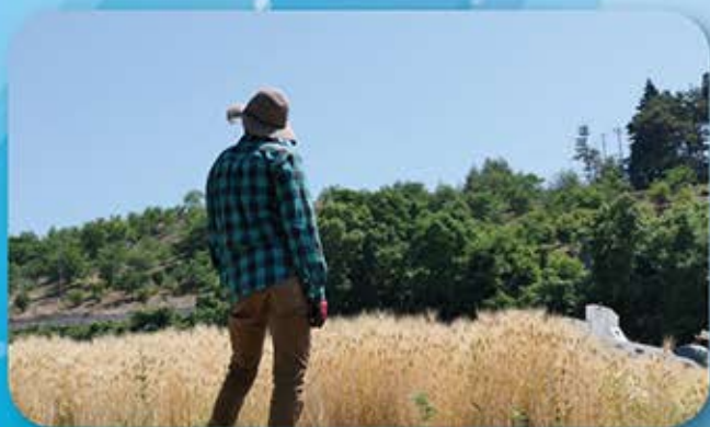
▲もち性大麦ホワイトファイバー