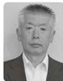
宮川 秀俊 議員

問 秋から冬にかけては再び感染拡大が懸念されている。インフルエンザの流行もあり、医療崩壊も起きかねない。村内で感染者や濃厚接触が疑われた場合のシミュレーション、また人権への配慮、プライバシー保護についての考えを伺う。 答 感染者、濃厚接触者への直接的な対応や観察業務については、保健所が一括して行うこととなっている。村としては連携し対応する。村民からの不安や相談は保健師が対応予定だ。村内で感染者が出た場合は、県から村へ情報提供がある。関係者の意向を十分に考慮し、村民に適切な情報を提供したい。小さな村では個人の特定がされやすいので、誹謗中傷の対象とならないよう慎重な取り扱いを