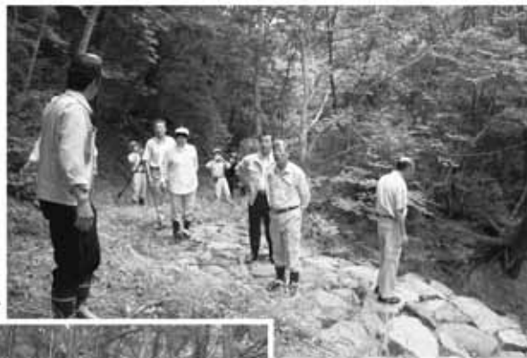
石積みえん堤(根尾) ▼▼

6月11日、貸別荘として活用する別荘と遊歩道を整備する根尾の石積みえん堤の現地調査を行った。