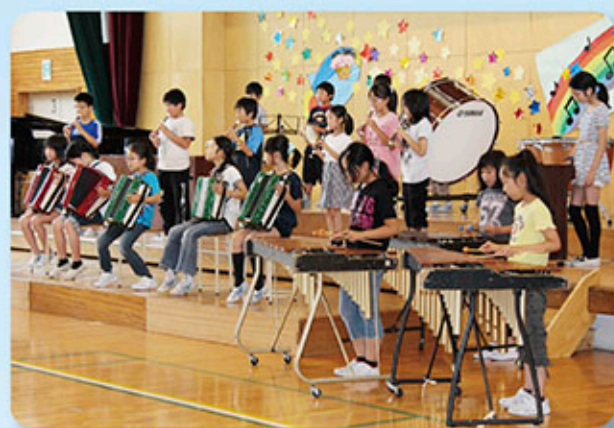
麻績小学校音楽会