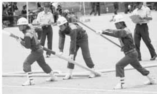
▲ポンプ車操法の部

「ポンプ車操法の部」へ7 チーム、「小型ポンプ操法の 部」へ9チーム、「ラッパ吹 奏の部」へは7チームが出 場し、麻績村消防団からは