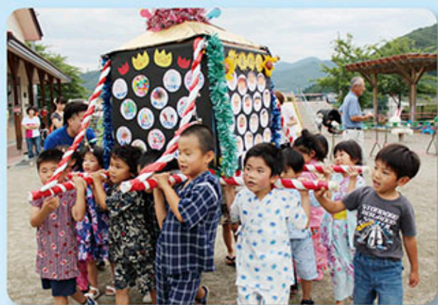
麻績保育園夏祭り