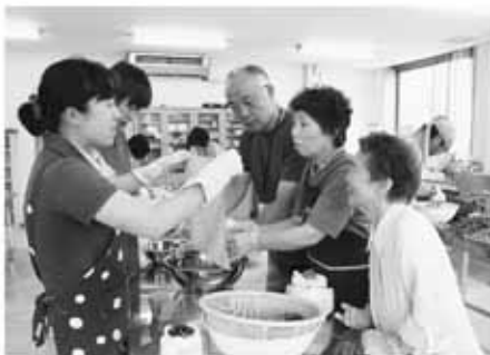
▲わくわく草木染体験

麻績村では、地域おこし活動に興味・意欲のある方を都市部から誘致し、新たな視点・発想により地域の活性化に取り組むため、平成23年度から「麻績村地域おこし協力隊」事業を始められています。地域おこし協力隊の任期は1年で、3年まで更新が可能です。