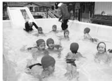
▲麻績保育園プール遊び