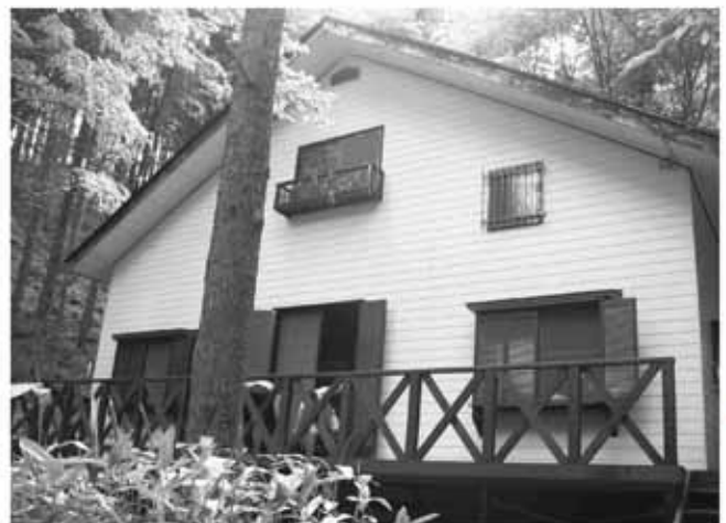
貸別荘として使用する建物