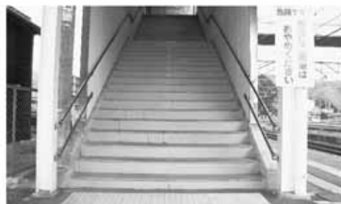
聖高原駅の階段に手すり設置を