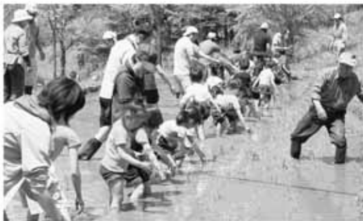
▲松本市ささべ幼稚園田植え体験

国民年金保険料を納め忘 れの状態、万一、障害や 死亡といった不慮の事態が 発生すると、障害基礎年金 や遺族基礎年金が受けられ ない場合があります。 経済的な理由等で国民年 金保険料を納付することが 困難な場合には、保険料の 納付が免除・猶予となる 「保険料免除制度」や「若 年者（30歳未満）納付猶予