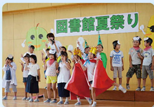
麻績図書館夏祭り