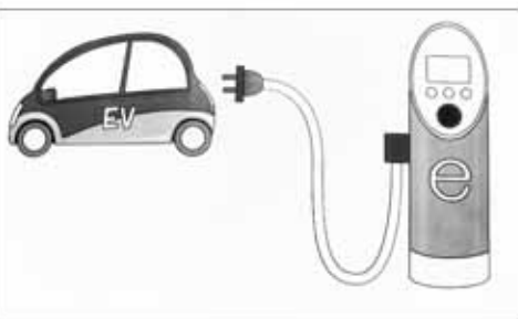
EV(電気自動車)充電設備(イメージ)

これによると、麻績村に3基必要とされているが、設置計画は。 答 県は、国の経済産省の次世代自動車インフラ整備促進事業を背景に、県内に充電インフラ整備を促進するため、本事業