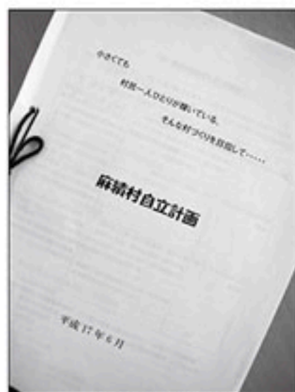
麻績村自立計画 (平成17年6月策定)