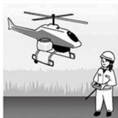
無人空中散布用ヘリコプター (松くい虫被害対策)

増加、25年度は確定ではないが750本を超えると思われる。無人ヘリコプターによる空中散布試験の実施は。 答 松くい虫の被害は予想以上の速さで拡大し、周辺市町村でも深刻な問題になっている。村ではその対策として、ヘリコプターによる空中散布と、被害木の伐採、煙蒸処理を実施している。 無人ヘリコプターによる散布については、近隣市町村の動向等を見ながら検討していきたい。