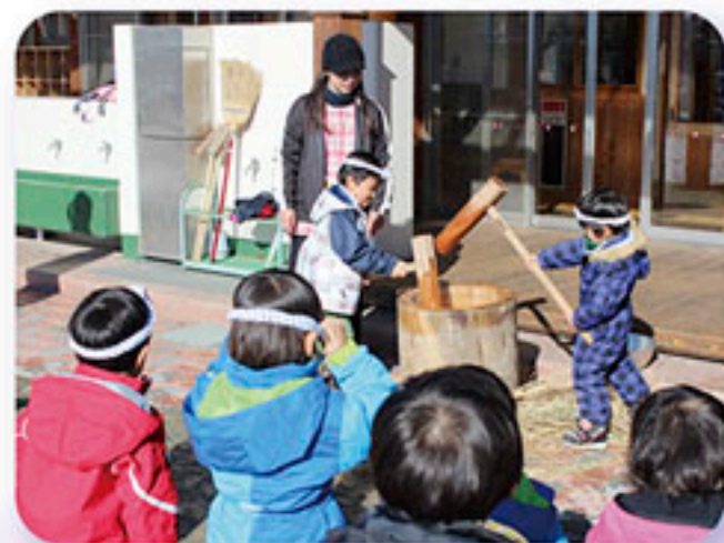
麻績保育園もちつき会