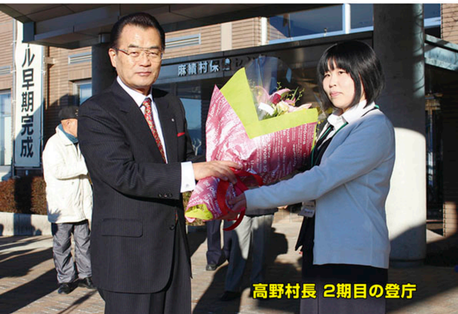
高野村長 2期目の登庁

人口 2,982人(男 1,384人 女 1,598人) 世帯数 1,164戸(H26.1.1現在)