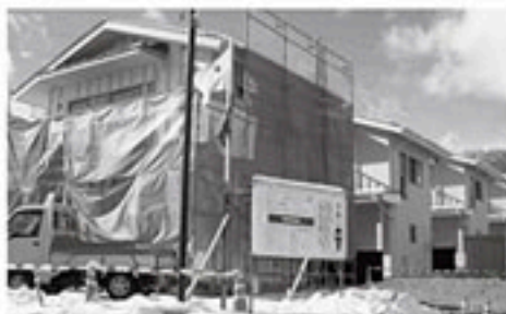
若者定住促進住宅(天王建築中)

答 「何もかも行政が手当するというのは、親の子育ての意識の軽薄化にならないか」との意見もある。実際に負担の大きい家庭もある事は承知しているが、限りある財源を他の子育て支援策に充てたいので、今のところは財源的に困難である。