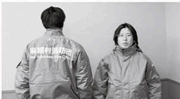
▲整備された防寒着

長野県の事業場で働く全 ての労働者と、労働者を一 人でも使用している全ての 使用者に適用される「長野 県最低賃金」が、平成25年 10月19日から時間額713 円に改正されました。 この機会に、ぜひ賃金の 確認をしてみてください。 お問い合わせ先 長野労働局労働基準部賃 金室 電話026-2223-05 55