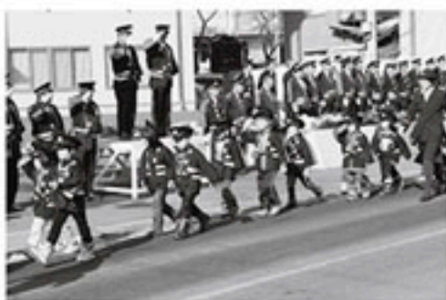
▲ちびっこ消防団出初式

A. 妊娠した女性(とくに妊娠20週頃まで)が風疹に かかると、先天性風疹症候群と言って、耳が開こえ にくくなる、心臓に奇形を生じる、目が見えにくく なる、精神や身体の発達の遅れが生じるなどの障が いを持った赤ちゃんが生まれる可能性があります。