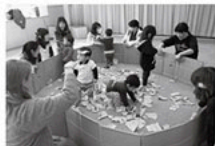
おもちゃのおうちの様子 (場所:保健センター)

答 国の補助金の所轄省庁が異なるため現状では困難。役場職員体制からも来年度以降に検討する。