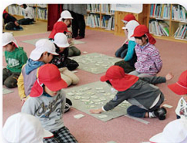
麻績小学校カルタ大会