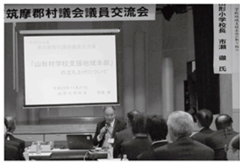
東筑摩郡村議会議員交流会(山形村)