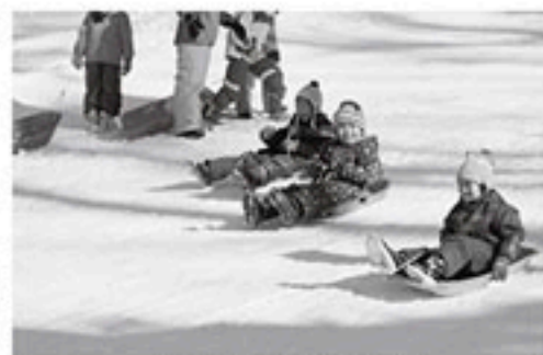
▲麻績小学校そり教室

定日の約1か月前に受診の ご案内をお送りいたします。 記入方法をご覧いただき、 漏れのないようにご記入く ださい。