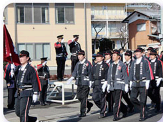
麻績村消防団出初式