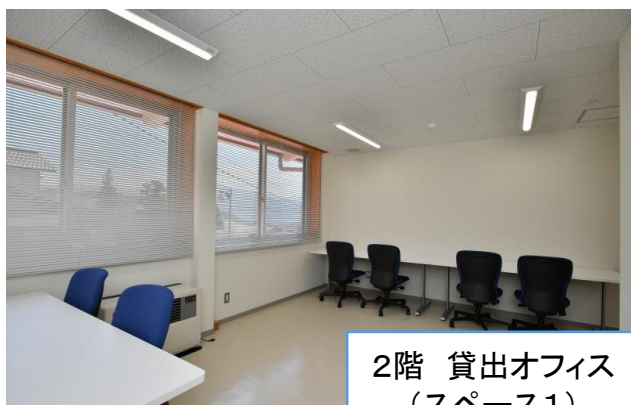
2階 貸出オフィス (スペース1)