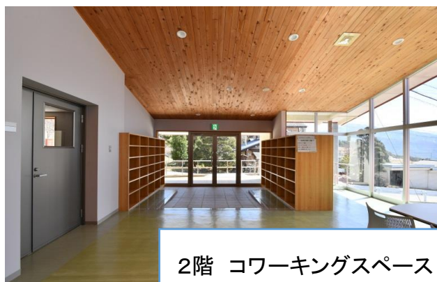
2階 コワーキングスペース